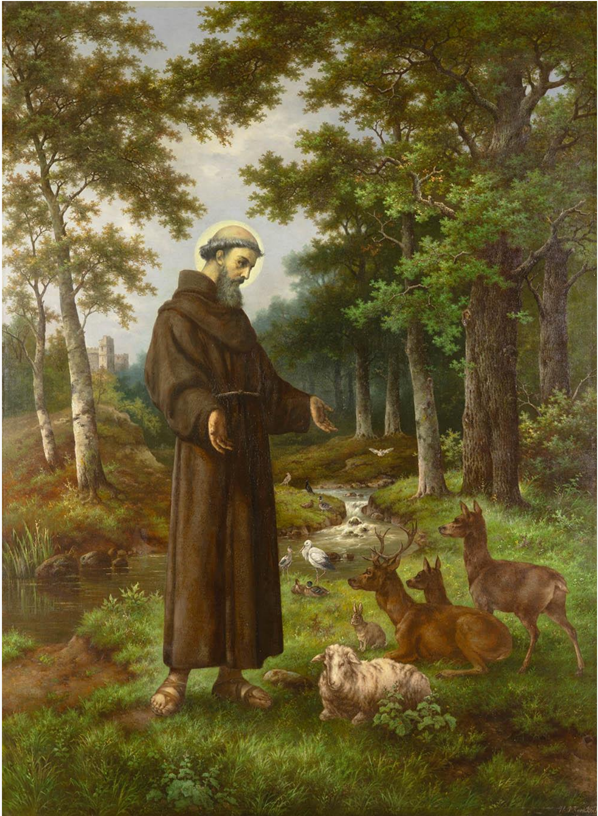
Franciscus en de Dieren, Hendrik Pieter Koekoek.