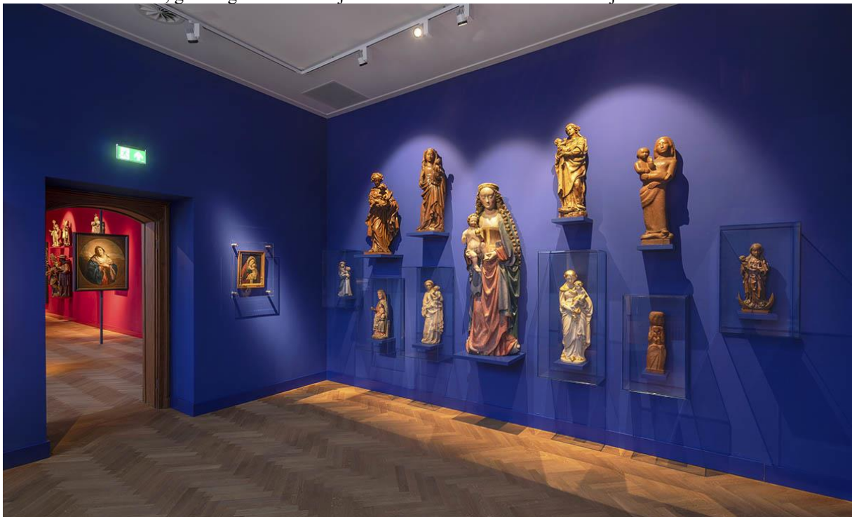
De kleurrijke zalen van museum W.