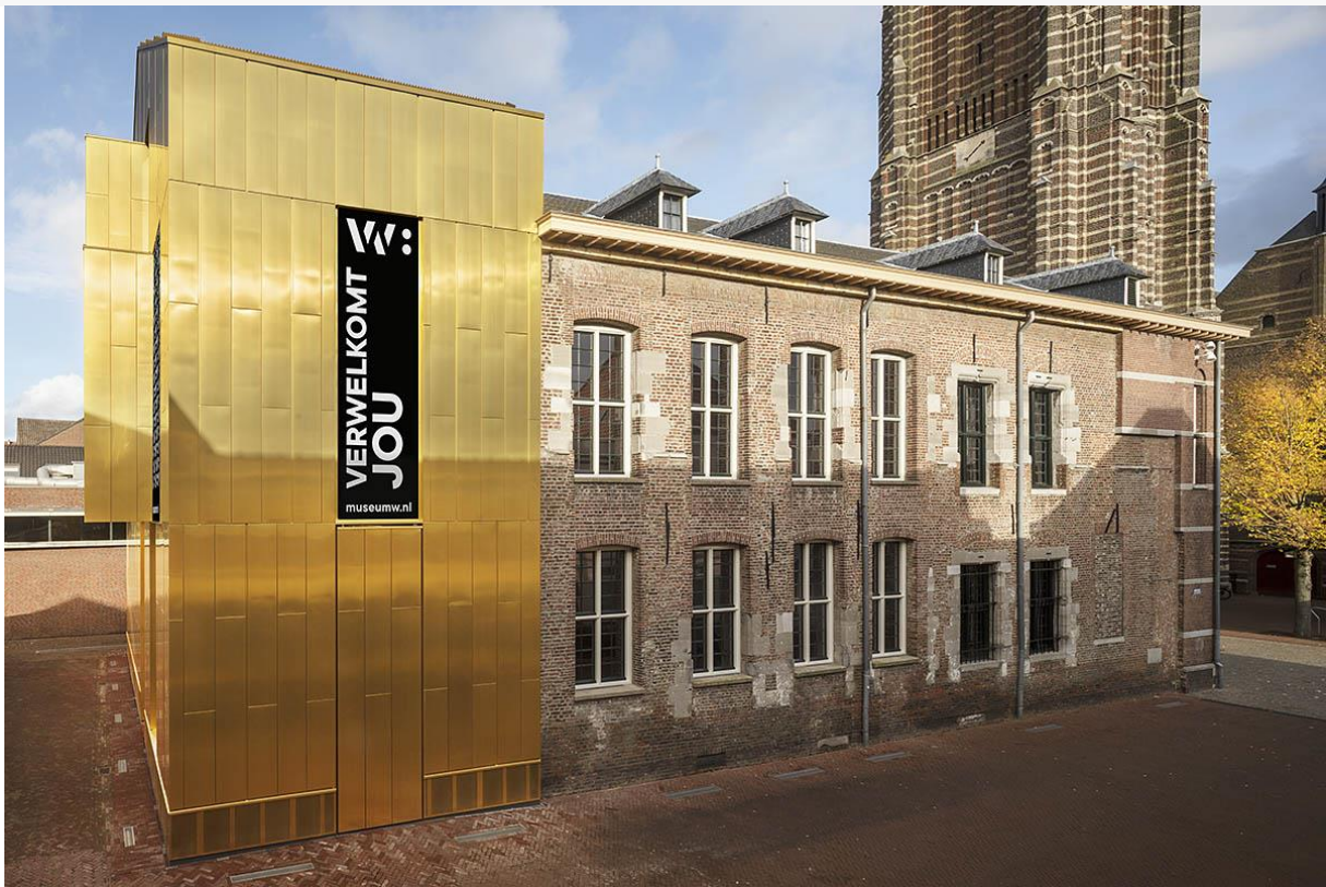
Exterieur Museum W, gevestigd in een oudtjids stadhuis van Weert.